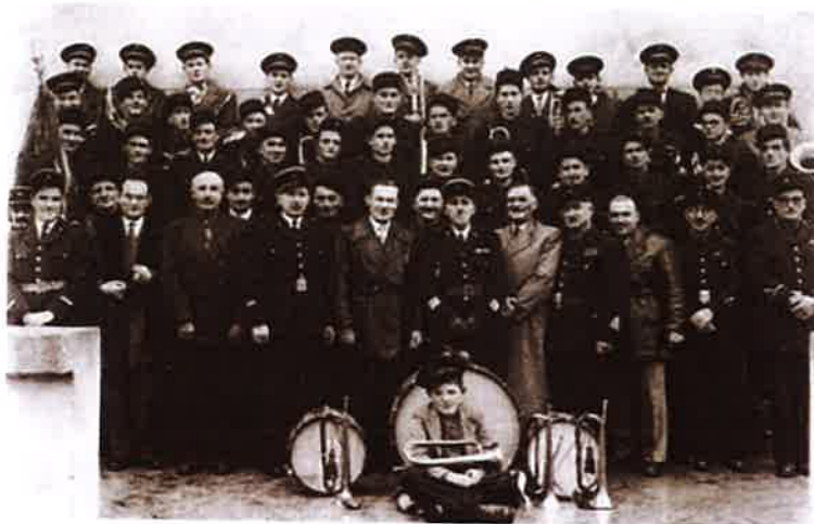
Après la guerre elle reprit ses activités jusqu'en 1928 et prit le nom de fanfare du Doulon. En 1946 fut créée l'Harmonie du Doulon et ces deux sociétés fusionnèrent en 1951.

Aujourd'hui, l'effectif n'est plus ce qu'il a été, mais la passion reste la même. C'est toujours avec motivation que la Lyre du Doulon, historique fanfare de la commune, perpétue cette tradition musicale et associative saint-germinoise. Derrière elle, plus de 130 années se sont écoulées... Un bail ! Et que dire du nombre de musiciens qui ont défilé dans ses rangs !