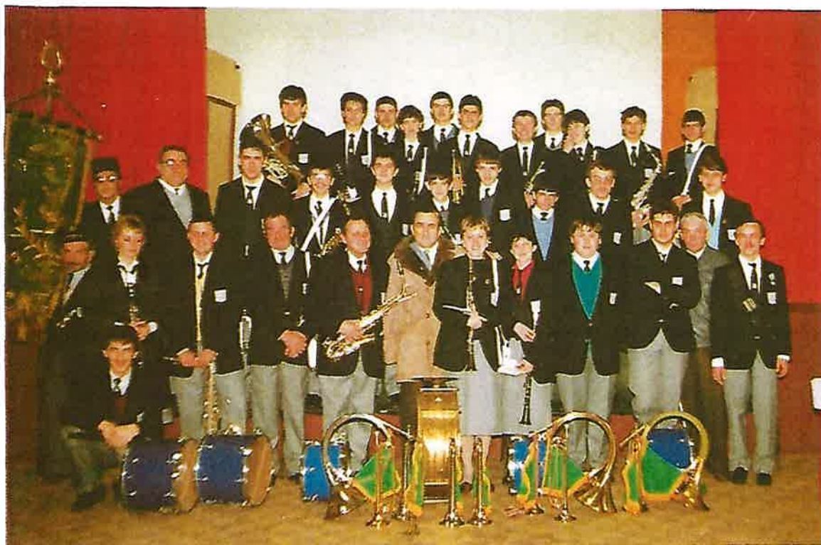
— LA LYRE DU DOULON