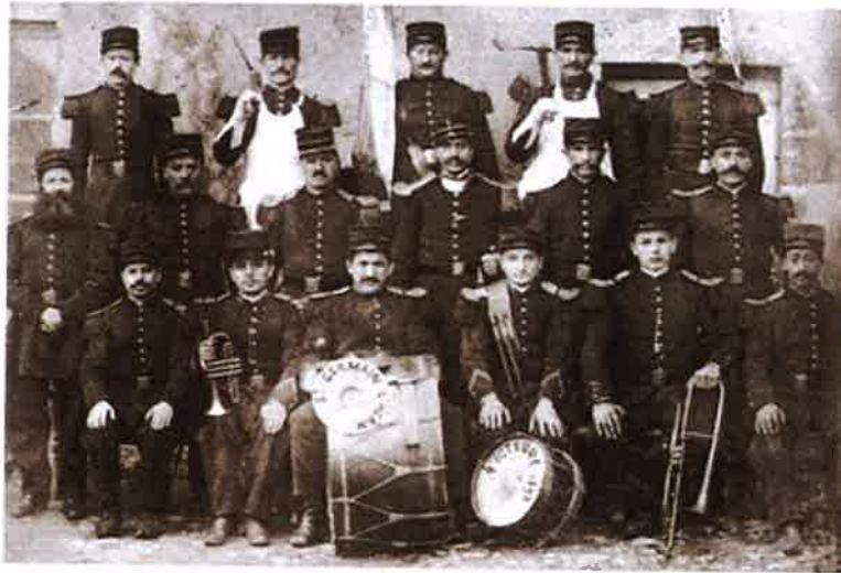
La Lyre du Doulon fondée en 1895 par les frères de St Gabriel jusqu'en 1914.

La Lyre du Doulon jette un œil dans le rétro