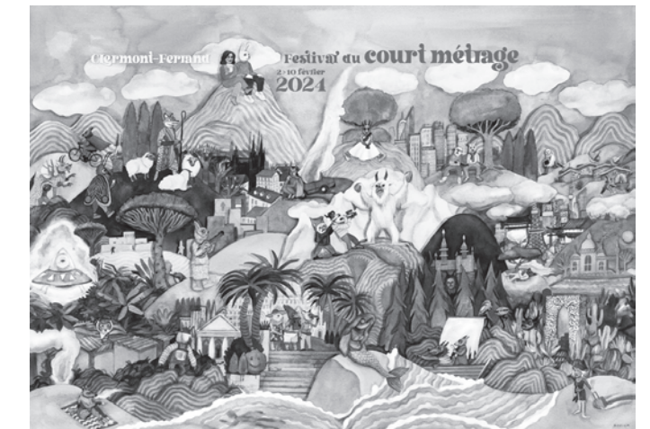
illustration : © Stacey Rozich